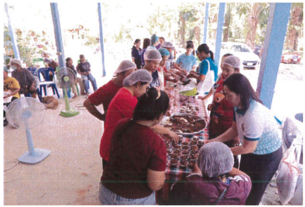
อบรมจัดทำขนมเปี๊ยะ